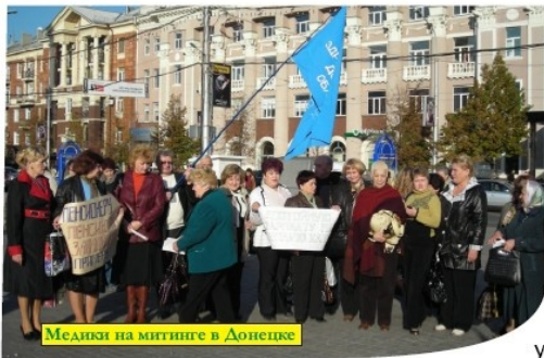
Медики на митинге в Донецке

Осеннее наступление профсоюзов, инициированное Федерацией профсоюзов Украины под девизом «Скажи бедности «Нет!», особенно мощно проявилось 7 октября, когда во всех регионах страны прокатилась протестная волна.